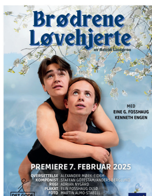
Brødrene Løvehjerte 22.februar