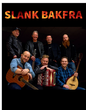
Slank Bakfra og Kastret Hannkatt 21.februar

Se vår hjemmeside for fullstendig program