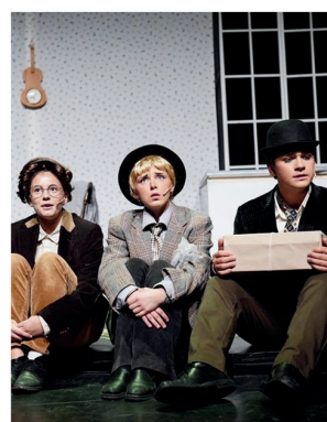
Olsenbanden Jr. på Cirkus 07.april