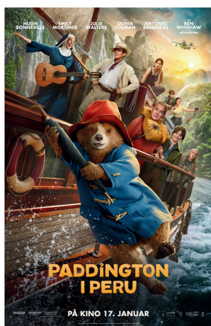
Paddington i Peru 17.januar