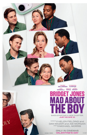
Bridget Jones: Mad about the boy 14.februar