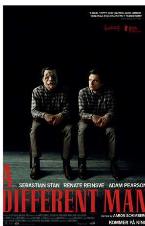
A Different Man 14.februar