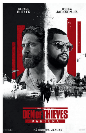
Den of Thieves 24.januar