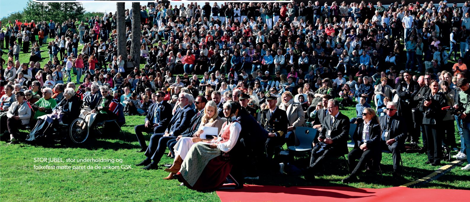
STOR JUBEL, stor underholdning og folkefest møtte paret da de ankom GSK.