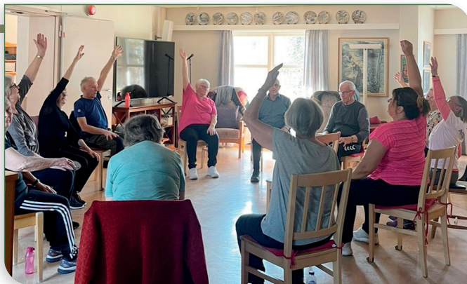
STERK OG STØDIG har blitt populære tilbud på begge bo- og dagsentrene. Det samme med ungdomsklubbene, som også holder hus der.