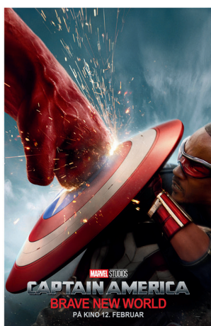
Captain America: Brave new world 12.februar