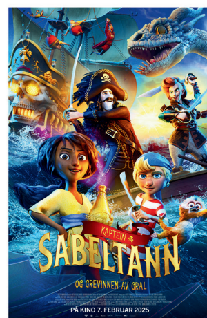
Kaptein Sabeltann 07.februar