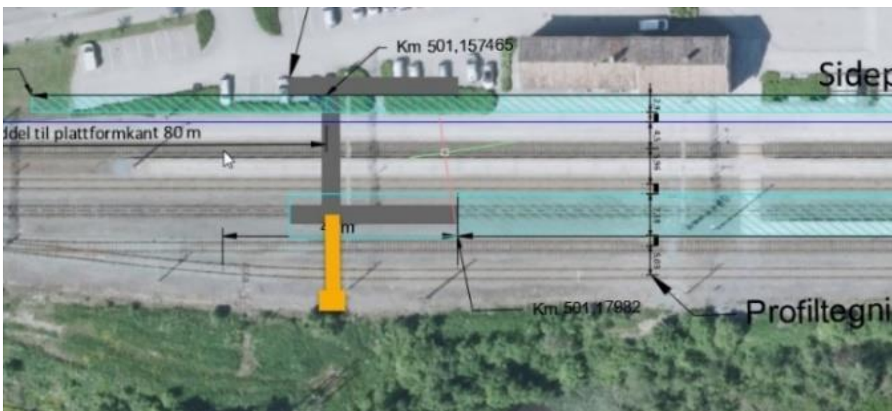
Figur 2 Mulig plassering av overgangsbru.

Det planlegges å etablere en overgangsbru rett sør for stasjonsbygget, til mellomplattformens sørlige ende og ev. videre østover til adkomstvegen til verksteds- og hensettingsområdet. Brua vil gi planskilt adkomst til mellomplattformen og ev. bedre gangadkomst til verksteds- og hensettingsområdet og områdene langs Gaula. Dersom overgangsbrua forlenges til adkomstvegen øst for stasjonsområdet, må vegen leges om noe. Mulig plassering av overgangsbru vises i Figur 2. Skisse for mulig omlegging av vegen er vist i Figur 3.