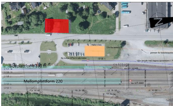
Figur 4 Alt. 1 viser ny P-plass på vestsiden av vegen Bygget. Rød firkant viser ny plassering.

Parkeringsplasser som fjernes for å bygge ny overgangsbru sør for stasjonsbygningen og for nytt spor i terminalområdet, må erstattes. Det er skissert to alternative løsninger. Det ene alternativet er å (1) etablere ny P-plass på vestsiden av vegen Bygget. Tomta eies av Bane NOR Eiendom, men er regulert til forretningsformål i reguleringsplan for Støren sentrum nord. Det andre alternativet er å (2) utvide P-plass nord for bussoppstillingsarealet/ skyss-stasjonen. Tomta eies av Bane NOR Eiendom og er regulert til jernbaneformål i reguleringsplan for Støren sentrum nord.