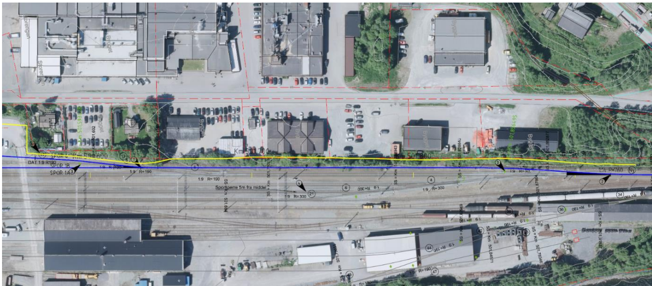
Figur 1 Nytt spor 1 ved næringsseiendommer i Bygget og ombygging av spor 6. Gul linje markerer skråningsutslag mot eiendommer langs Bygget.

Det planlegges å etablere et nytt spor 1 vest for dagens spor 1. Spor 6 til beredskapsterminalen skal også bygges om. Nytt spor 1 vil komme ca. 3 meter fra stasjonsbygningen og vil ligge innenfor areal som er regulert til hensynssone bevaring kulturmiljø. Videre vil midten av det nytt spor 1 ligge ca. 5 m fra eiendomsgrenser for næringsbebyggelse langs østsiden av vegen Bygget. Anleggsområde og ev. skråningsutslag vil sannsynligvis berøre disse eiendommene, og det vil bli behov for midlertidig erverv fra disse eiendommene. Det kan derfor være aktuelt å regulere deler av næringsseiendommene som er regulert til forretning/industri i reguleringsplan Støren sentrum Nord, til midlertidig anleggsområde.