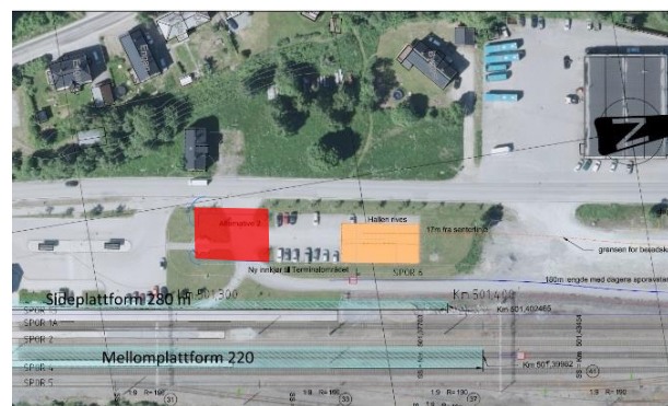
Figur 5 Alt. 2. viser utvidelse av parkeringsplassen nord for bussoppstillingsarealet/ skyss-stasjonen. Rød firkant viser ny plassering.

Det er regulert fortau på østsiden av vegen Bygget i reguleringsplan for Støren sentrum nord. Denne reguleringsplanen er eldre enn 10 år og gir nå ikke hjemmel for erverv. Det er nå aktuelt å etablere fortauet. For å sikre hjemmel for nødvendig erverv av grunn til fortauet, omfatter planområdet vegen Bygget. For å sikre nødvendig areal i anleggsperioden kan det også være aktuelt å regulere deler av næringseiendommene som er regulert til forretning/industri i reguleringsplan Støren sentrum Nord, til midlertidig anleggsområde.