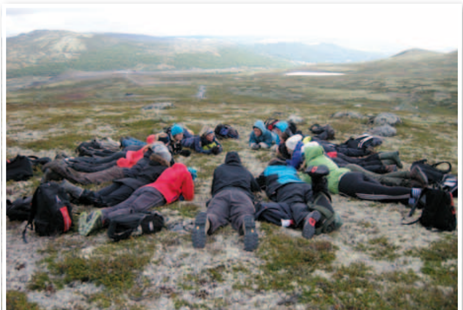
Fra feltundervisning på Hjerkin.