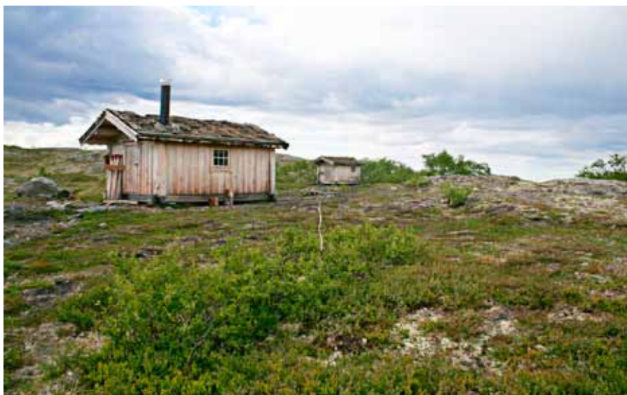
Pilegrimsbua ved Vardene er åpen og har to sengeplasser.