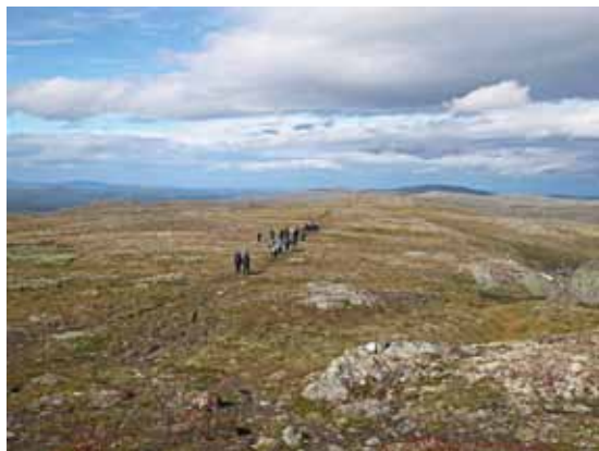
Pilegrimsleia tar ofte over åpent fjellandskap, og byr på storslått utsikt utover dalførene.

Pilegrimsleia er fellesbetegnelsen for de gamle ferdselsveiene pilegrimene benyttet seg av, knyttet sammen i et nettverk. De strekker seg over hele landet, og for det meste leder de frem til middelalderens store pilegrimsmål, Nidaros og Nidarosdomen, selv om også et par andre inngår, som for eksempel St. Sunniva-klosteret på Selje.