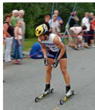
Maxpuls. AdrenalinVukku er tøffe tak og høy puls. Marit Bjørgen har vært suveren på rulleskirennene under AdrenalinVukku, og stiller igjen i år om hun kan.