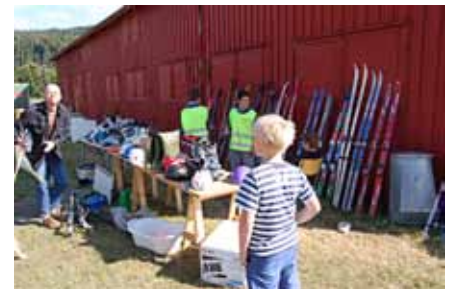
Ski sommerstid. Loppemarkedet har noe for enhver sesong.