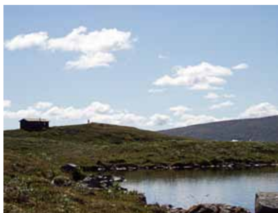
Bua ved Langtjønnan ligger ved Forollhognas fot, omgitt av gode ørretvann.

I nasjonalparken og hele kommunen for øvrig, finner du åpne buer som gir