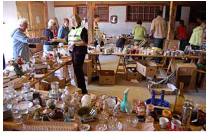
Fuller bord. Bordene bugner av gode tilbud. Her kan du finne en skatt, eller koppen du mangler i settet etter bestemor.

Et morsomt innslag som vekker interesse under Loppisen.