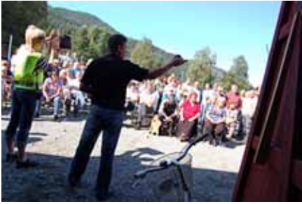
I år bli det auksjon.

Folk har mange ting til overs og mye til overs for foreningsarbeid. Det beviser Størensportsklubbs årlige loppemarked. Kopper og kar, pynt og bruk, møbler og klær og bøker - noen gir avlagte ting, andre bare for å gi. Og noen gjør begge deler. Uansett - når Leir'n åpnes for loppis, er den full, full av gode tilbud og kjøpelystne folk.