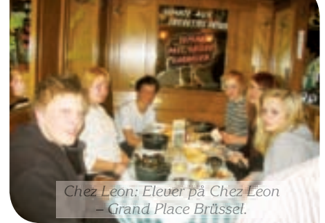
Chez Leon: Elever på Chez Leon – Grand Place Brussel.

er det fokus på samarbeidsprosjektet Gauldal skole- og kultursenter. Vi er nå inne i en fase hvor prosjektet krympes og effektiviseres for å få til så lave kostnader som mulig, øke sambruken og samtidig holde funksjonaliteten oppe. Samspillgruppen, som er sammensatt av planleggere, entreprenører og brukere, var sammen på Bårdshaug den 15. mai i et brukerseminar hvor planleggerne fikk de siste innspill før forprosjekt legges fram for fylkeskommunal behandling. Etter min mening, så har prosessen som har forgått siden oktober 2007, vært en meget positiv prosess, og jeg er godt tilfreds med resultatet. Dess mer vi arbeider med prosjektet, ser jeg mer og mer at behovet for ny skole er økende. Det skyldes ikke bare at vi i dag har mangler og funksjonelle krav ut fra lover og forskrifter, men mer ut fra samfunnets behov for å satse på skole og utdanning. Samvirket mellom videregående, ungdomsskole, kulturskole, idrettshall, bibliotek og kultursal, som vi får til i GSK-prosjektet, er et unikt tilbud som vi bare har mulighet for å få til i et slikt prosjekt. Skal vi løse dette hver for oss, så blir kostnadene større for hver enkelt, og vi får ikke til å skape det unike samspillet som er den store kvaliteten i GSK-prosjektet.