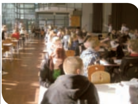
Mattliden: Kantine for 1100 elever i en 1–12 skole – Mattliden Gymnasium i Helsingfors.