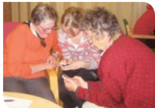
"Trykk OK": Generasjoner forenes over mobiltelefonen.

Etter ønske fra deltakerne og andre som ikke hadde anledning denne kvelden, ble det arrangert kurs en kveld til. Frivillighetssentralen har også tidligere arrangert tilsvarende kurs.