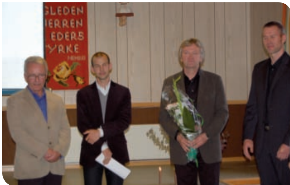
Dyrvik arkitekter leverte det beste forslaget og vant konkurransen.

14. september avslørte juryen hvem av de konkurrerende arkitektkontorene som i deres øyne hadde det beste forslaget til et skole- og kultursenter for Midtre Gauldal.