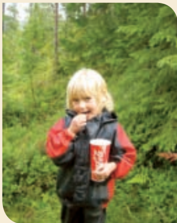
Forsidebilde: Blåbærtur.