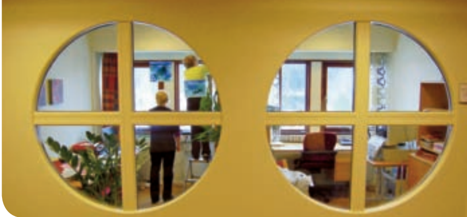
Kulturens koøyne gir innblikk, eller utsyn, alt etter som.