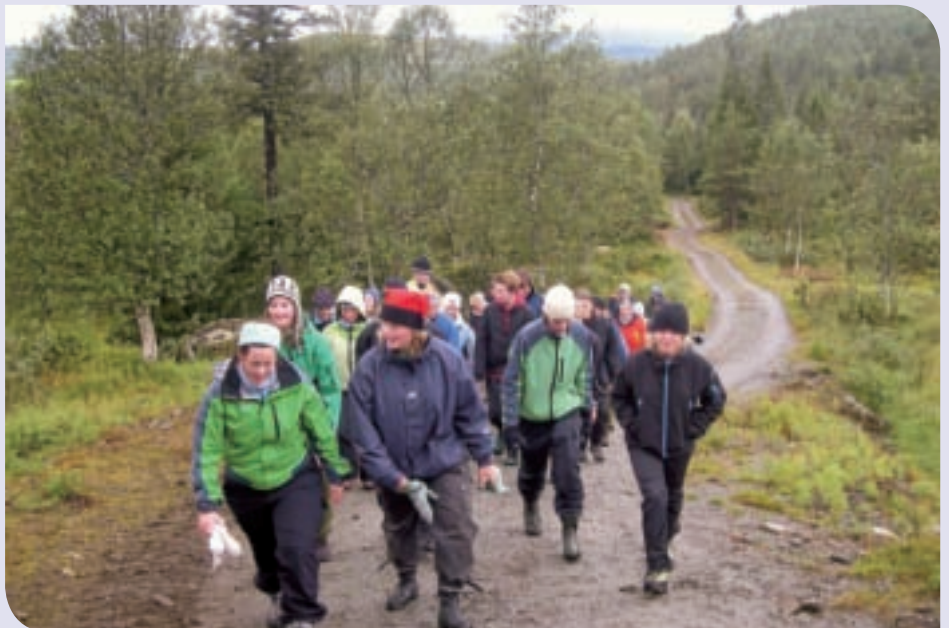
Elevene beholdt humøret til tross for at naturen ikke riktig fikk vise seg fra sin beste side.

Fjellturen måtte vi dessverre droppe denne gangen, for fjellet kledde seg i vinterdrakt og trakk tåka godt ned over fjelltoppene.