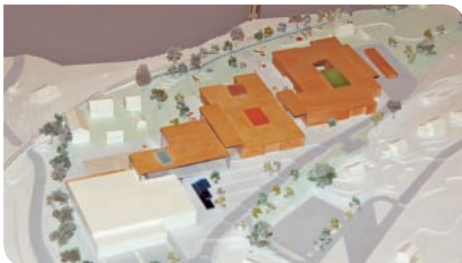
Sett fra luften får en først skikkelig inntrykk av prosjektets omfang.

le. Bygget rommer da også alt det er ment å skulle romme: Idretts-hall, kulturhus med bibliotek, kino og konsertsal, ungdomsskole og hele Gauldal videregående skole. I følge jurymedlem og begeistret rektor for kulturskolen, Arnfinn Solem,