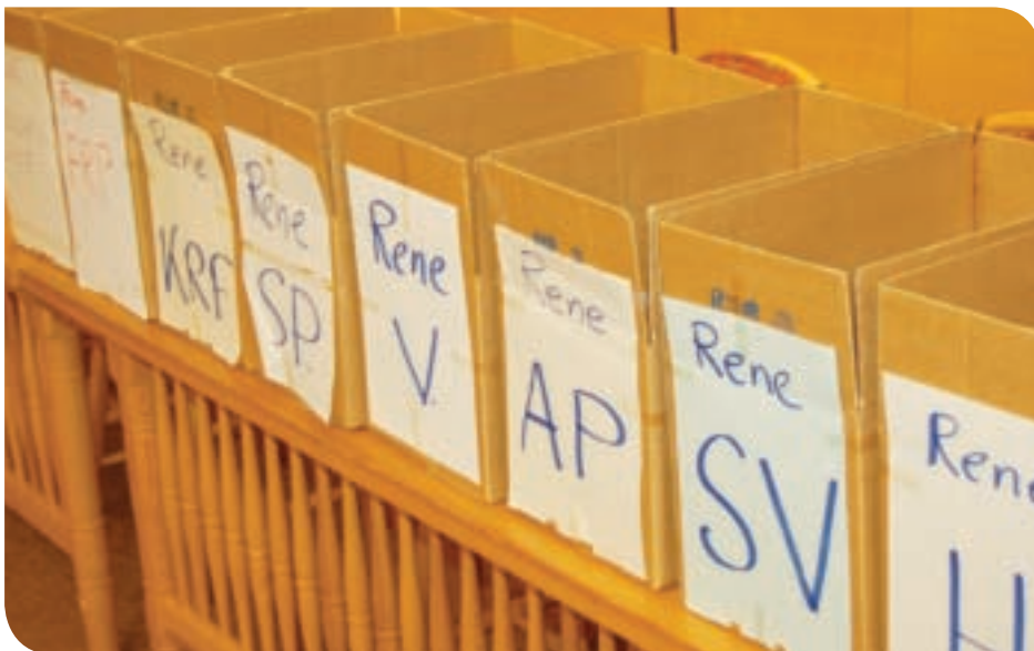
Manuell stemmetelling: Ikke særlig imponerende, men feilfritt.