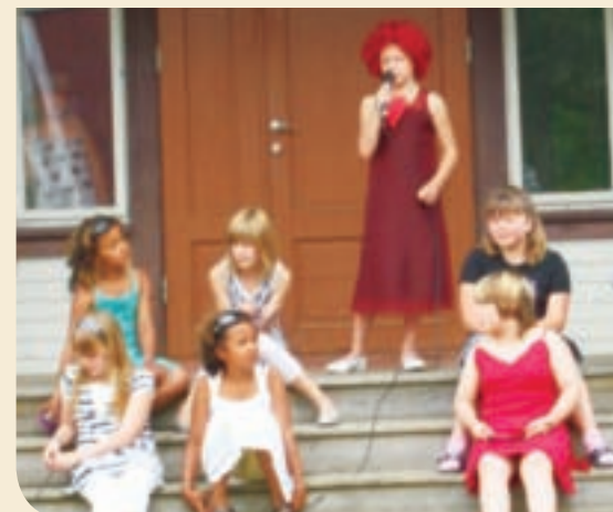
Et stort publikum overvar musikalen som markerte avslutningen på Kulturleiren 2007.