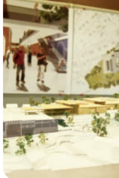
Omtrent slik vil kommunens storstue møte de besøkende når de kommer opp mot inngangen (fasaden på Størenhallen er fotomanipulert).

finnes det bare ett lignende anlegg i hele Norden, og det ligger på Island! Dermed er det en sjanse for at GSK kan bli et pilotprosjekt i Norge, med de fordeler det bringer med seg av oppmerksomhet og tilskudd.