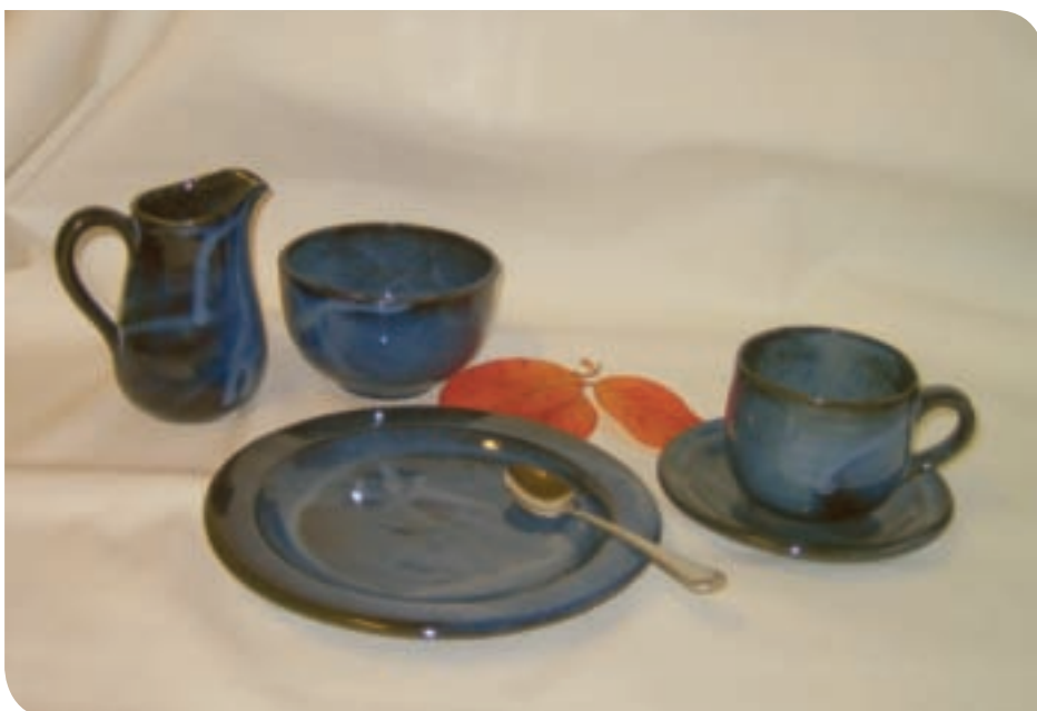
Keramikk: Det serieproduserte kaffeserviset er et populært produkt.