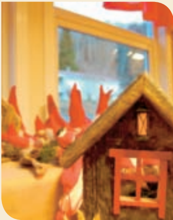
Forsidebilde: "Fra Lysgården".