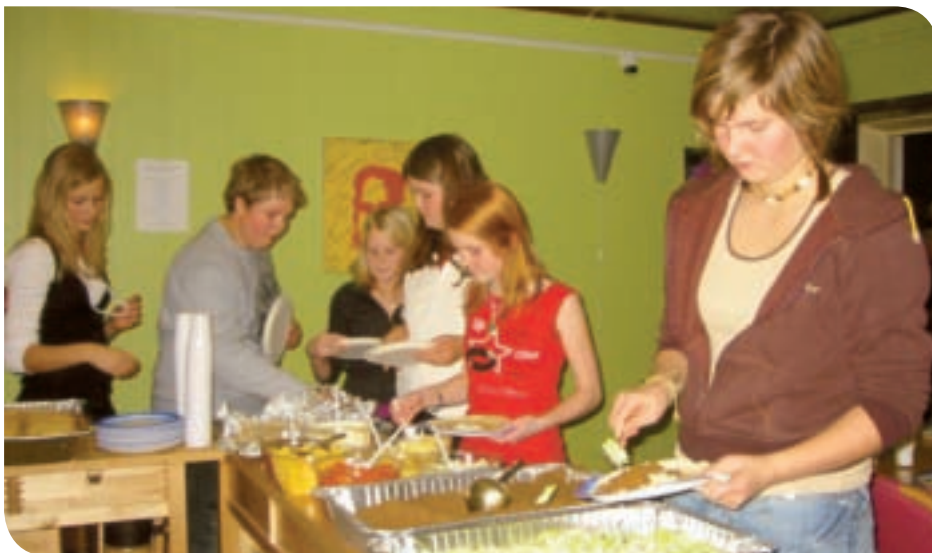
Ungdomsklubben feiret 2 år. Dagen ble markert med fet tacobuffet.

28.november hadde klubben fokus på "Ungdom og psykisk helse" med rockemusikk av bandet LOST fra Soknedal, avspenningsøvelser og informasjon om Psykisk helse. Det var gratis inngang, taco og brus til alle. Et populært tiltak – hele 80-90 ungdommer møtte opp! Klubben er en verdifull møteplass for de unge på Støren og bygdene rundt. Den er