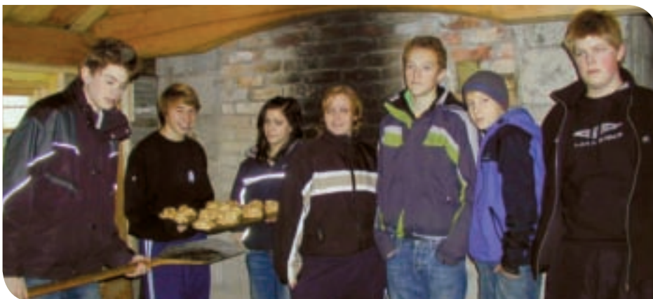
Elever fra ungdomsskolen i "Ounsrøret bakeri".