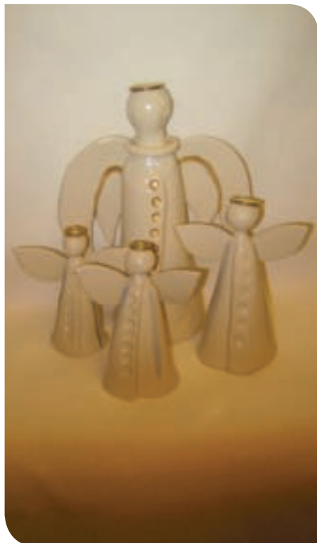
Engler: Englene er del av en større julekrybbe.