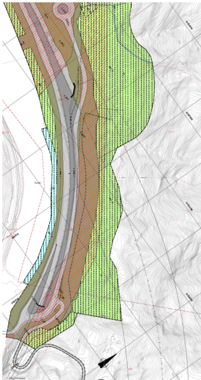
Figur 1: Utdrag av planforslaget ved Håggåatunellen

Administrasjonen har vært i kontakt med planavdelingen i Melhus kommune for å drøfte muligheten for å videreføre fortau/gang- og sykkelveg frem til rundkjøringen ved Rostad som fører nordgående trafikk fra Støren sentrum ut på E6. Denne dialogen har ikke ført frem. Planmyndigheten må ta stilling til om det skal fremmes formelle innspill til Melhus sin høring av samme planforslag.