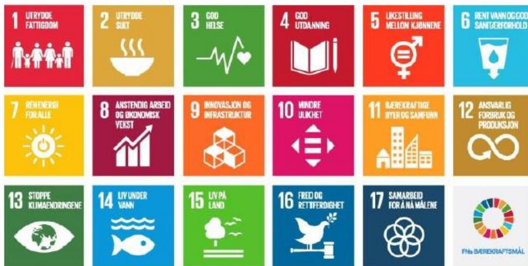
Figur 2: FNs 17 bærekraftsmål