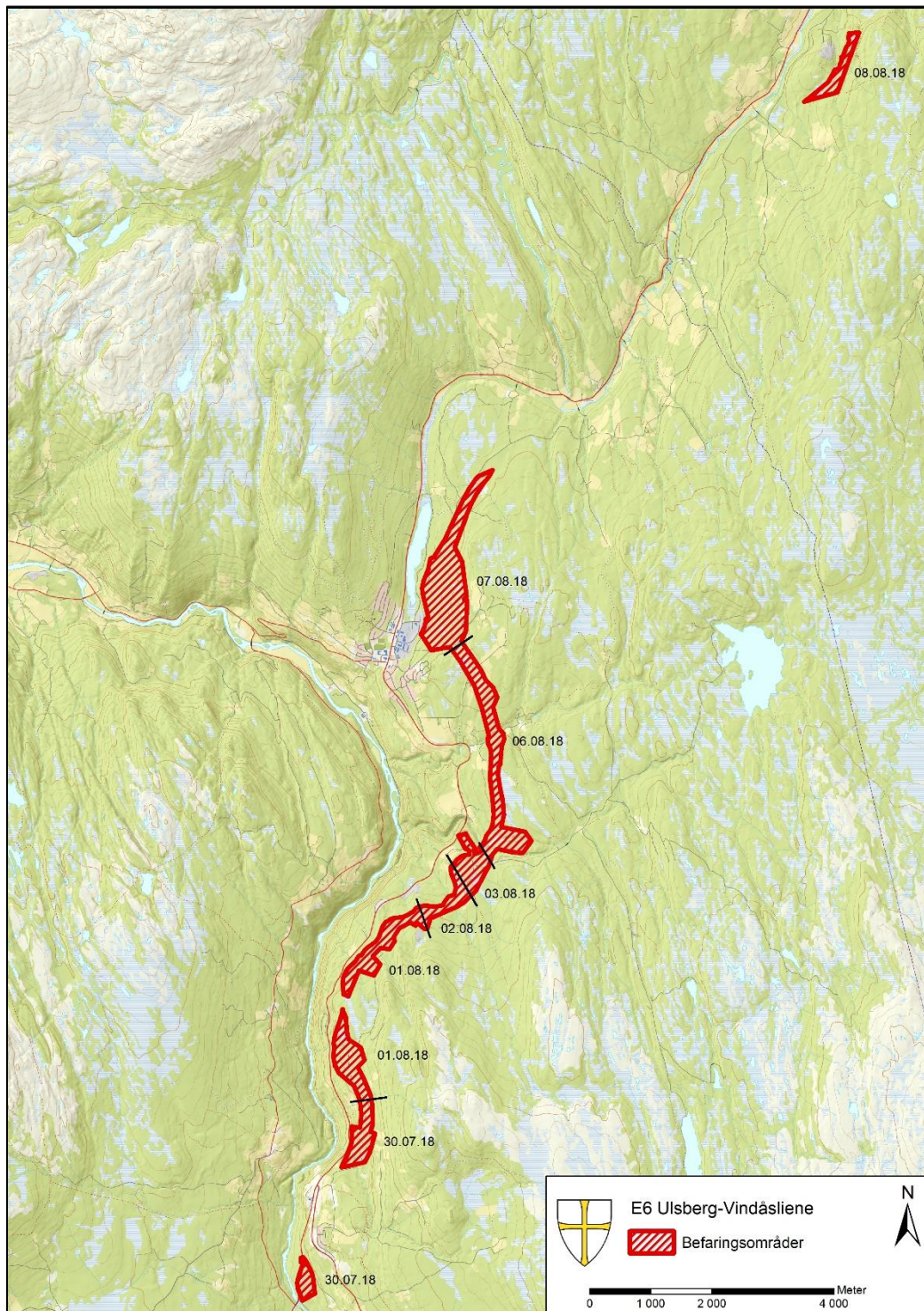
Figur 5: Oversikt over når de ulike delene av planområdet ble befart. Kart: Hanne Bryn, Trøndelag fylkeskommune.