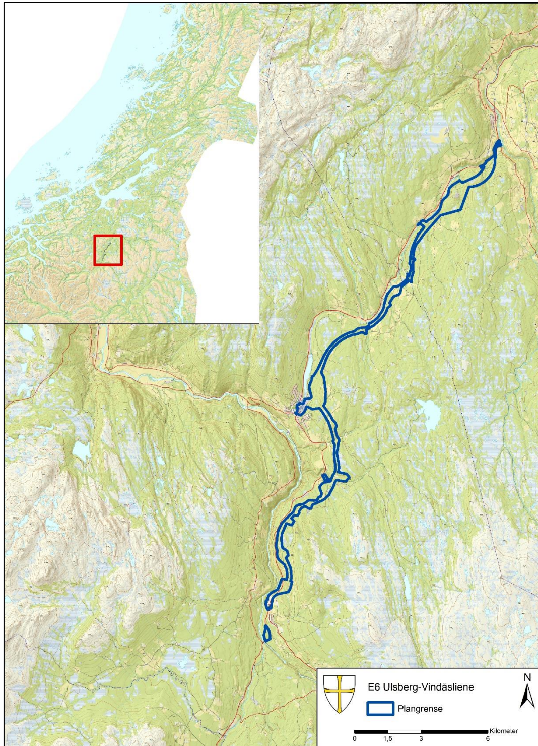
Figur 1: Oversiktskart over planområdet for E6 Ulsberg-Vindåsliene. Kart: Hanne Bryn, Trøndelag fylkeskommune.