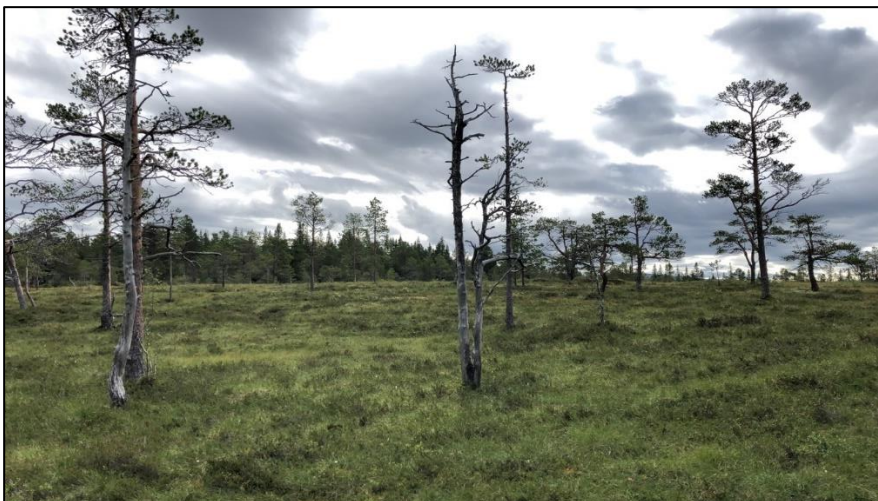
Figur 4: Mye myr innenfor planområdet.

Befaringen ble startet i den sørlige delen av planområdet. Deretter ble det sakte, men sikkert befart nordover. Generelt sett var planområdet dominert av myrområder med enkelte tørrere områder innimellom. Enkelte deler av traseen var også bratt og ulendt. Potensialet for funn av automatisk fredete kulturminner innenfor planområdet ble ansett som lav. Det ble ikke gjort nye funn av automatisk fredete kulturminner innenfor planområdet.